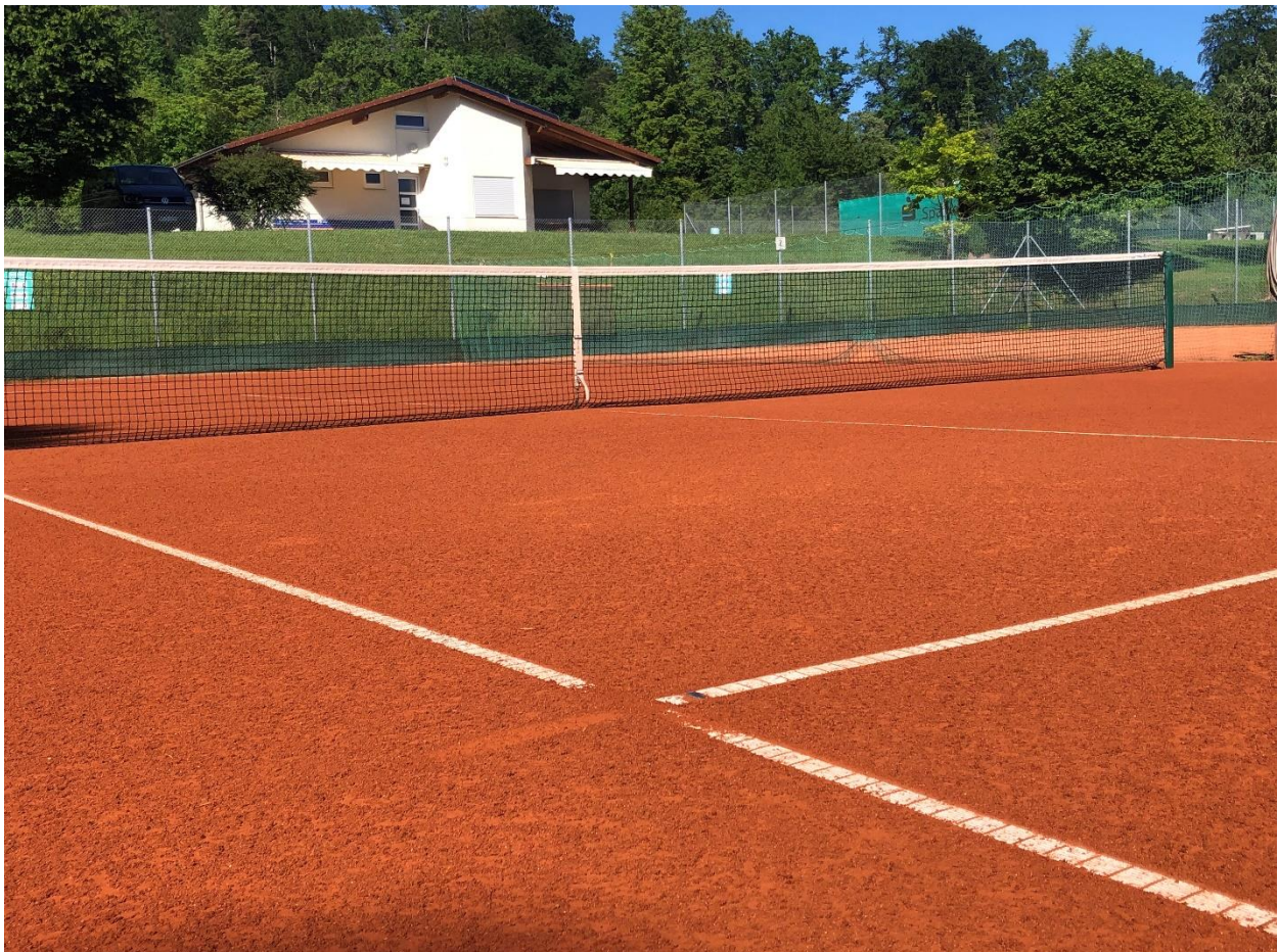
Die Tennisanlage und das Clubhaus des SV Althengstett

Wettkampfspieler können sich bei der Clubmeisterschaft mit clubinternen Mitgliedern oder im Interclub mit Spielern aus anderen Tennisclubs messen. In allen Alterskategorien bieten wir Trainerstunden (Gruppen- oder Einzelunterricht) an.