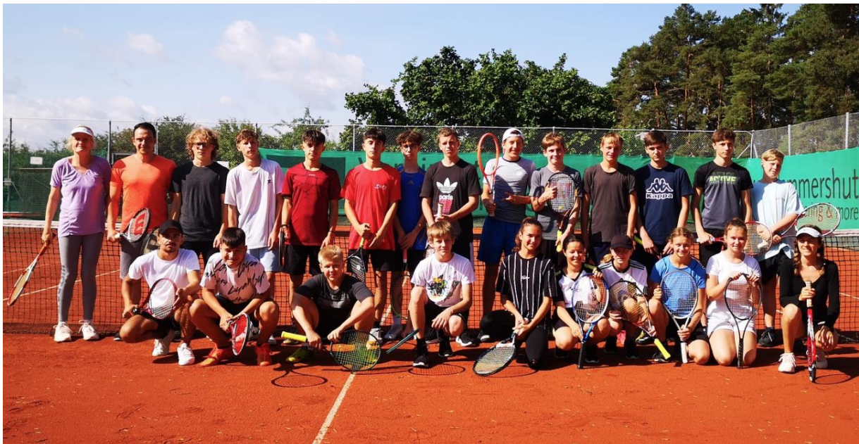
Die Teilnehmer der Gemeinschaftsschule 2023

Im Rahmen einer Kooperation mit der Gemeinschaftsschule Althengstett bieten wir seit dem Schuljahr 2022/2023 die Tennis AG an. Sie wird professionell von einer unserer Trainerinnen geleitet und krönt die Saison mit dem Tennissportabzeichen. Auch hier bekamen wir bereits positives Feedback und konnten erste Neumitglieder bei den Jugendlichen gewinnen. Wir sind zuversichtlich, künftig erneut eine Jugendmannschaft anmelden zu können.