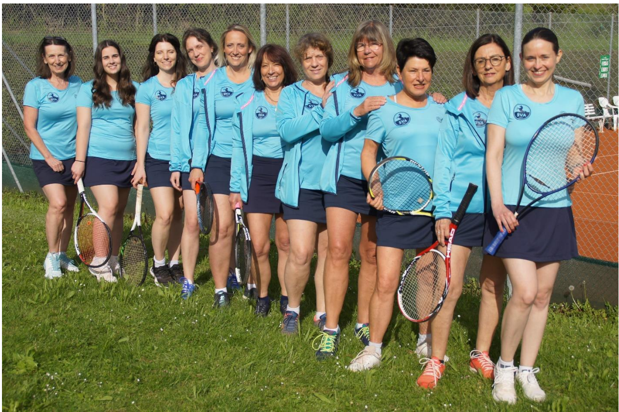
Die Mannschaft Hobby Damen des SV Althengstett