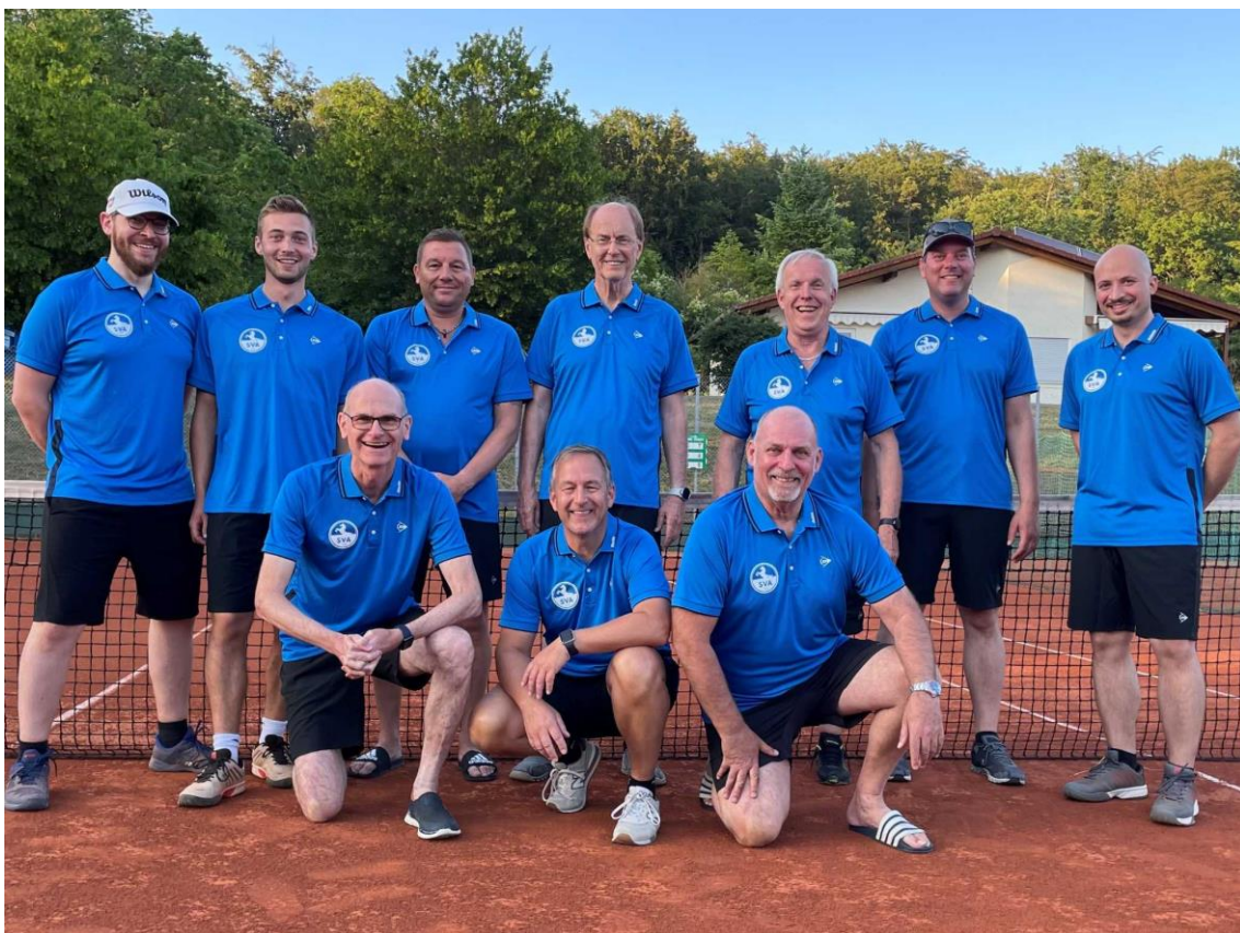
Die Mannschaft Hobby Herren des SV Althengstett