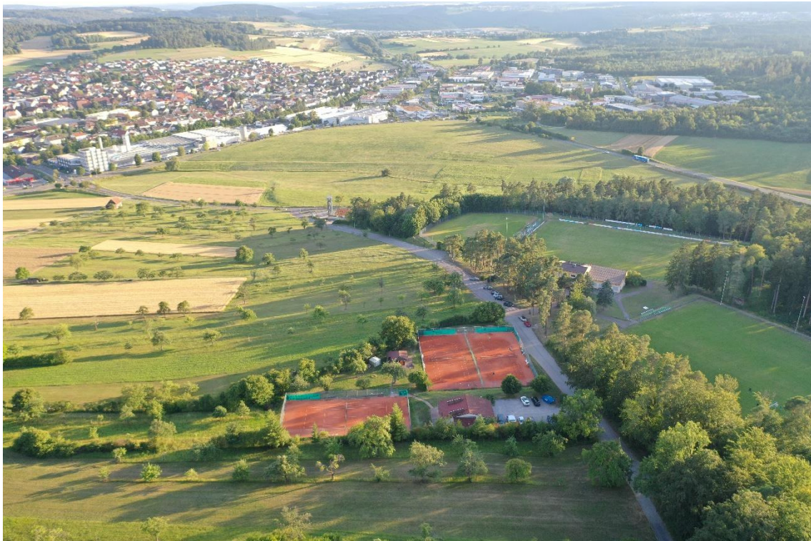
Die Tennisplätze des SV Althengstett in idyllischer Lage

Mit unserem Sponsoring Konzept wollen wir interessierten Unternehmen Gelegenheit geben, unsere Tennisanlage als attraktive Kulisse für sich zu nutzen.